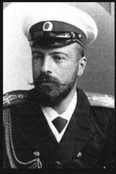
Великий князь Александр Михайлович Романов

“На страже русских национальных интересов стоял не кто иной, как интернационалист Ленин, который в своих постоянных выступлениях не щадил сил, чтобы протестовать против раздела бывшей Российской империи”.