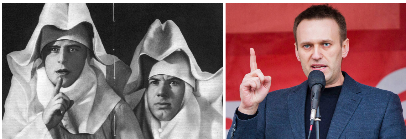
Слева — кадр из советского фильма «Праздник святого Йоргена» (1930 г.). В кадре главный мошенник, которого играет Анатолий Кторов, и его помощник, которого играет Игорь Ильинский. Справа — Алексей Навальный на одном из митингов.

Есть ещё Алексей Анатольевич Навальный и «навальнята». Там тоже нет проекта будущего, одно только неприятие настоящего. Но такая характеристика недостаточна. Писать об этом много желания нет, но картинки ниже показывают суть.