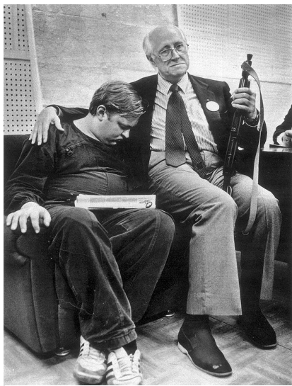
Виолончелист М.Л. Ростропович в здании Верховного Совета РСФСР в дни ГКЧП в 1991 г.

Среди деятелей отечественной культуры место Иосифу Кобзону нашлось, Мстиславу Ростроповичу 2 — нет.